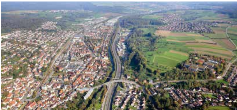
Luftbild unteres Filstal (Ebersbach)

Naturliebhaber finden zwischen Albtrauf und Streuobstwiesen eine wunderbare Landschaft, die zum Radfahren, Wandern und Erholen einlädt. Daneben bieten die bedeutenden Heilquellen von Bad Boll, Bad Ditzenbach und Bad Überkingen Gesundheit und Entspannung.